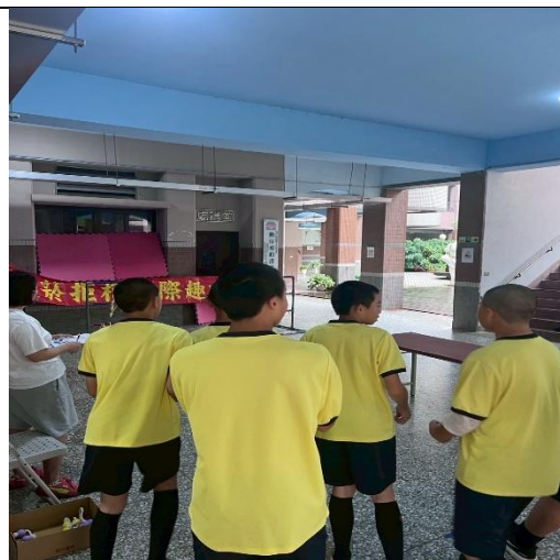
114. 05. 29 反菸拒檳盃十項全能挑戰賽。