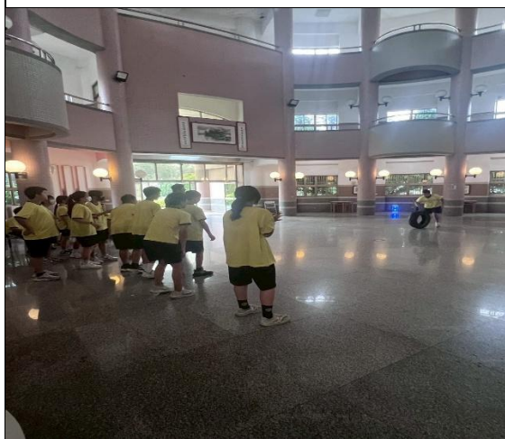
114. 05. 29 反菸拒檳盃十項全能挑戰賽。