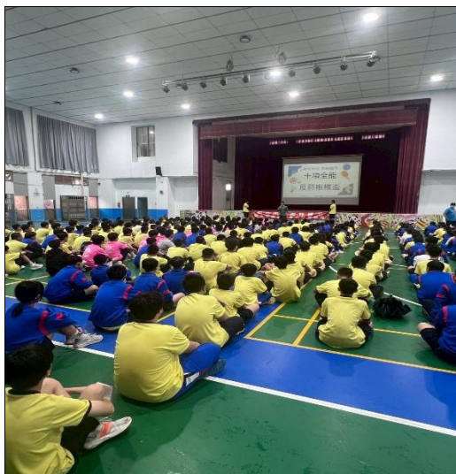
114. 05. 29 反菸拒檳盃十項全能挑戰賽。