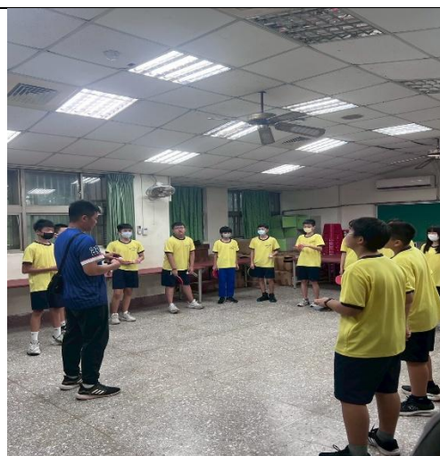
114. 05. 29 反菸拒檳盃十項全能挑戰賽。