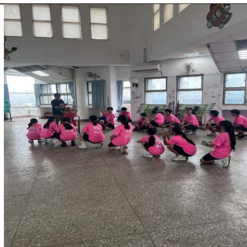
114. 05. 29 反菸拒檳盃十項全能挑戰賽。