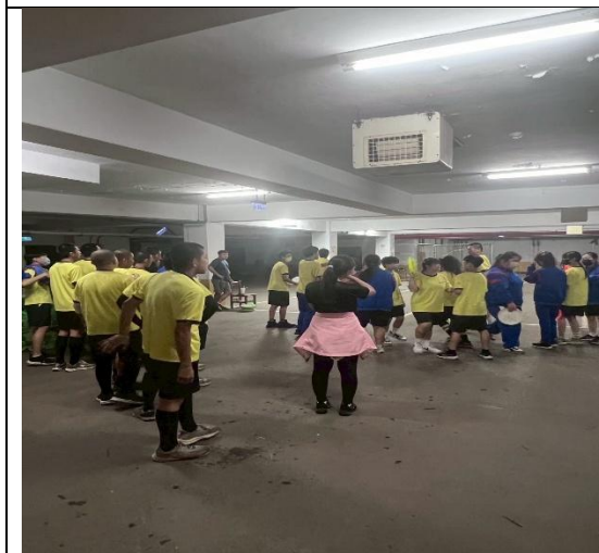
114. 05. 29 反菸拒檳盃十項全能挑戰賽。